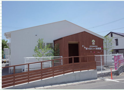
健やかな成長の場に。食育と自社農園での体験学習、外国語教育にも力を入れています。