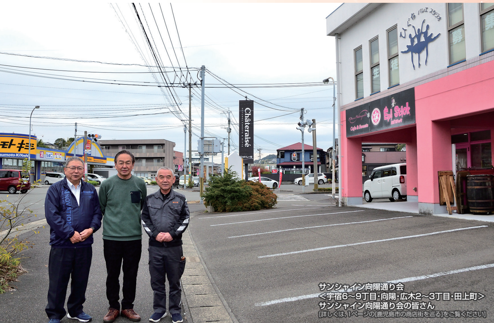
サンシャイン向陽通り会 ＜宇宿6～9丁目・向陽・広木2～3丁目・田上町＞ サンシャイン向陽通り会の皆さん [詳しくは、1ページの[鹿児島市の商店街を巡る]をご覧ください]